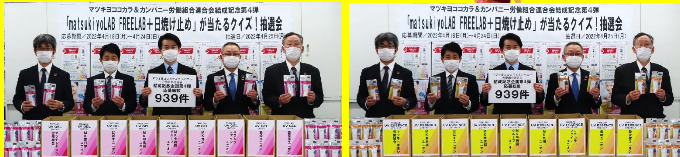
左から MC&C労連岡副会長、大石会長代行、阿部人事戦略室長、MC&C労連砂川会長、遠藤事務局長